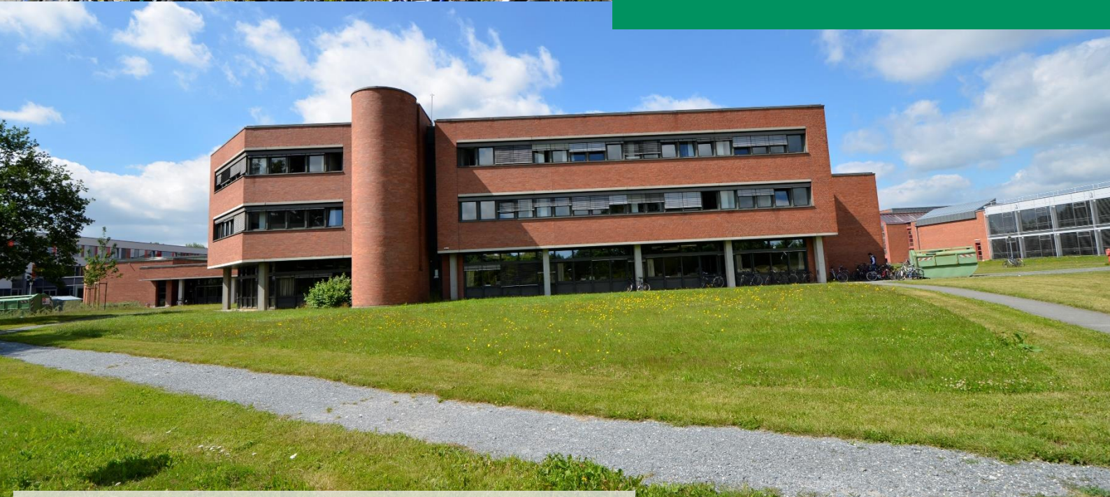
Rechs- und Wirtschaftswissenschaftliche Fakultät der Universität Bayreuth Neues Hauptgebäude (oben) und Altes Hauptgebäude (unten)