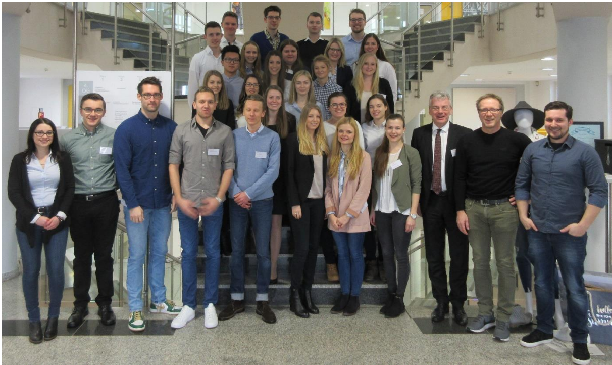
Teilnehmer des Forschungsprojekts „Innovations- und Dialogmarketing“ vor der Präsentation der Ergebnisse in der Zentrale des Versandhändlers Baur in Weismain am 19.1.2018

Ein inzwischen bewährtes und stark nachgefragtes Lehr- und Forschungsformat sind die Forschungsprojekte: Master-Studierende erproben – intensiv betreut – hier die in den Lehrveranstaltungen vermittelten methodischen Ansätze in Zusammenarbeit mit Unternehmen. Sie werden so bestens auf eine empirische Abschlussarbeit vorbereitet. Im Sommersemester findet jeweils das Forschungsprojekt „Data Mining im Marketing mit R“ statt. Dort lernen die Studierenden R und Python kennen und werten umfangreiche Daten mittels Data Mining- und Machine Learning-Verfahren aus. Sie diskutieren Stärken und Schwächen der verschiedenen Ansätze und entwickeln Handlungsempfehlungen für Unternehmen. Im Sommersemester 2017 nahmen 42 Master-Studierende teil, waren wie immer engagiert, begeistert, haben viel gelernt. Zeitgleich wurde erstmals ein Forschungsprojekt zu Geschäftsmodellinnovationen bzw. Kooperationen von Unternehmen mit StartUps durchgeführt. 18 Teilnehmer entwickelten Lösungsansätze und Konzepte für disruptive Veränderungen.